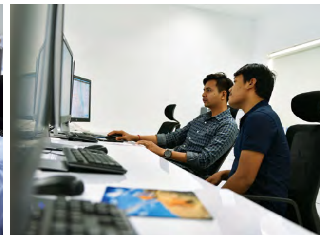
▲ 住友電工のITS運用のノウハウは、すべて現地スタッフへと伝授される