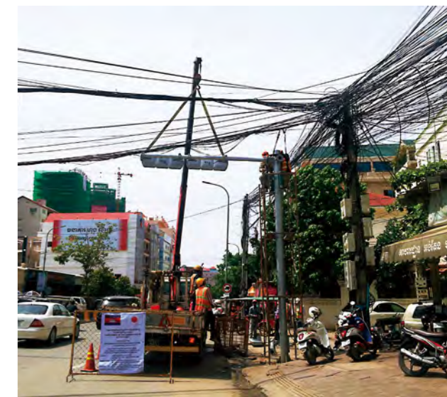
▲ 蜘蛛の巣のように張り巡らされた電線を縫って、進められる工事