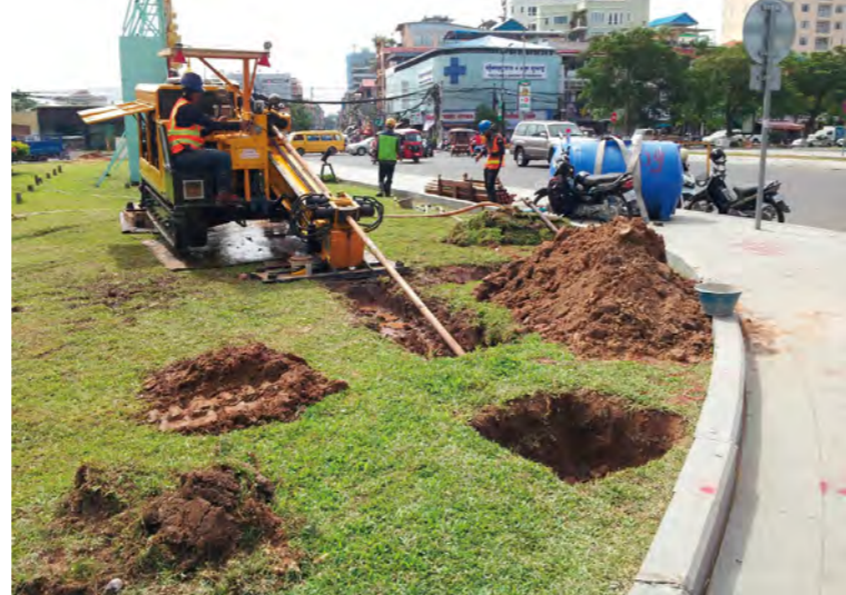
交通を遮断することなく工事を進めることができる水平ドリル工法

工事はまず、交差点を掘削し埋設管路やハンドホールを設置し、信号制御機に通信・電力を供給するケーブル敷設から始まった。順次、基礎工事、建柱の後、信号灯器を取りつけ、信号機を稼働させていった。この段階では管制センターと接続していない状態だったが、「市民に新しい信号機を早く見せたい」