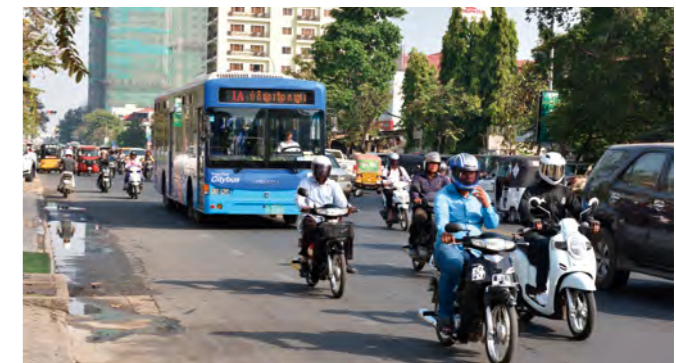
交通渋滞を緩和すべく、公共交通機関の整備も始まっている