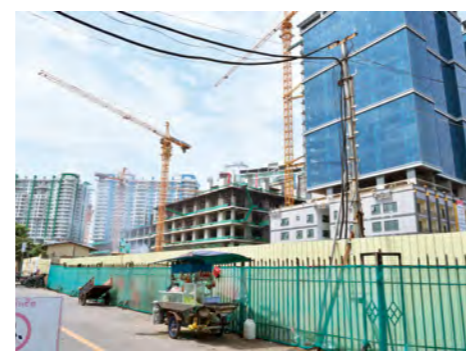
プノンペン都内では、いたるところで建設ラッシュが相次ぐ

2015年3月、無償資金協力に関する交換公文の署名が行われた。三菱商事からコンソーシアム結成の打診を受けて住友電工