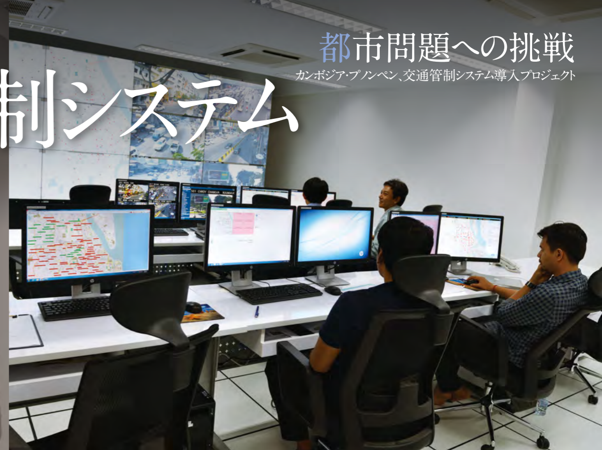
▲ 完成したプノンペン都・交通管制センター。交通状況は地図と動画により、マルチスクリーンで一望できる