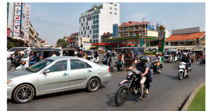
経済成長の証は、急激に増えたバイクの量に表れている