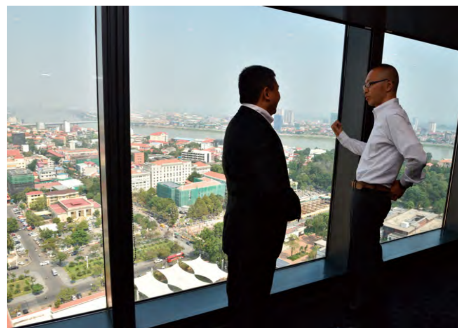
三菱商事と住友電工の密なコミュニケーションが、本プロジェクトを成功に導いた

三菱商事の本店では ODA 案件を担う経済協力部が、プロジェクトを主管した。同部では同時期にプノンペン都向けにバス供与