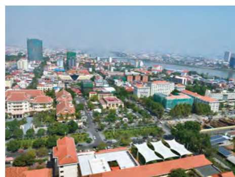
「東洋のパリ」と謳われる美しい街並みが残るプノンペン都

共交通導入、信号機・交通管制システム等のITS(Intelligent Transport Systems=高度道路交通システム)導入を含む短中期計画が示されました。その中で最優先プロジェクトの一つに位置付けられたのが、信号機・交通管制システム等のITS導入でした。当時、プノンペンには信号機が整備された交差点が69カ所ありましたが、その多くが交差点ごとに独立して稼働しているものであり、都市全体に点在する信号機と連携された制御システムとなっていないため、交通混雑に対応できない状況だったのです。こ